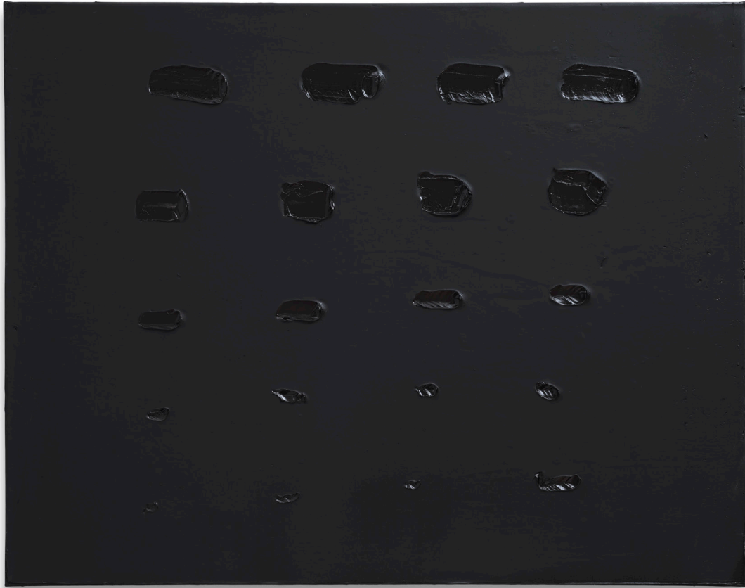
皮耶·蘇拉吉，繪畫 101 x 130 厘米，2015 年 8 月 16 日，丙烯 畫布，101 x 130 厘米 (39 ¼ x 51 ⅞ 吋)

在現代物理學領域，色彩被視為眼睛對不同頻率光波的感知，而形式則與材料的形狀息息相關。光、能量和材料之間的內在關係在藝術中也一樣，模糊而精深。對藝術家而言，形式與色彩之間的創造性關係自 4 萬多年前第一幅洞穴壁畫以來，便被本能而持續地探索著。