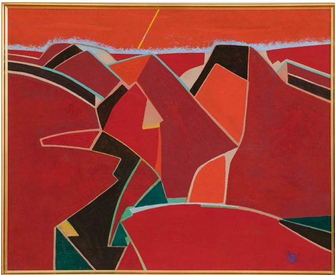
弗朗索瓦吉洛· 山脈 ·1991 年作·油彩·畫布 81 x 100 厘米 (31 7/8 x 39 3/8 吋)

春華秋實呈現二十及二十一世紀藝術家眼中的色彩美學，已故美國普普藝術先驅詹姆斯·羅森奎斯特創作於 1990 年的作品《無題》就是一件色彩豐富，情感豐沛的作品。羅森奎斯特自 20 世紀 60 年代起作為普普運動的先驅蜚聲國際，與安迪·沃霍爾、羅伊·利希滕斯坦等齊名。藝術家融合商業藝術技巧，以大膽的構圖，對流行圖像及日常物品作開創性重組，與同時代的藝術家一起改變了藝術史的面貌。在《無題》中，以花卉為主導的畫面被覆蓋上不規則的條狀拼貼，若隱若現的女性嘴唇與眼眸神秘而誘惑，實現了對熟悉圖像的超現實並置。此作品亦延續了藝術家自 80 年代中期開始的以花卉與女人為主題的創作，而此系列中最富盛名的《花卉，魚與女人》（1984 年作）現為美國大都會藝術博物館永久館藏。