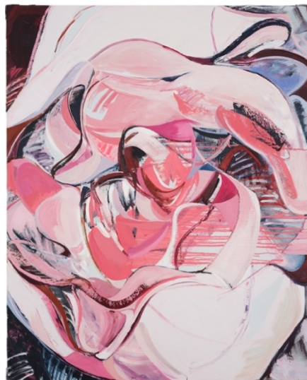
張子靄· 花蕾 01 ·2021 年作·油彩·畫布 175 x 140 厘米 (68 7/8 x 55 1/8 吋)