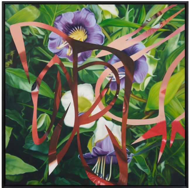
詹姆斯·羅森奎斯特， 無題 ，1990 年作，丙烯 畫布 面板 152.4 x 152.4 厘米 (60 x 60 吋)，圖片：詹姆斯·羅森奎斯特

香港——厲蔚閣亞洲榮幸宣布，將於香港空間呈獻新一期主題展覽「春華秋實」，揭開厲蔚閣亞洲 2022 年首展序幕。展覽於 2 月 28 日揭幕，匯聚中西方傑作，探索藝術家眼中的四季更迭、生命演變乃至宇宙萬象。焦點涵括戰後及當代大師，如弗朗索瓦·吉洛、草間彌生、詹姆斯·羅森奎斯特的作品。而來自陳世英、丁乙、梁纓、劉建文、倪有魚、唐永祥的創作則為華人藝術發出新聲。此外，隨著厲蔚閣在全球範圍內的整合，藝術家瑪麗蓮·敏特、伊麗莎白·尼爾及貝蒂·伍德曼的作品亦將首次與厲蔚閣亞洲的觀眾見面，成就豐富多元的美學之旅。